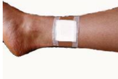
Fixace preparátu Cerdak